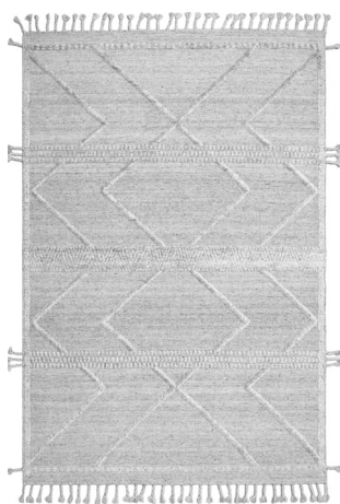
CLN 6197 Argento/Grigio