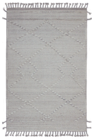
CLN 6194 Avorio/Grigio Chiaro

Disponibile su misura Custom sizes available