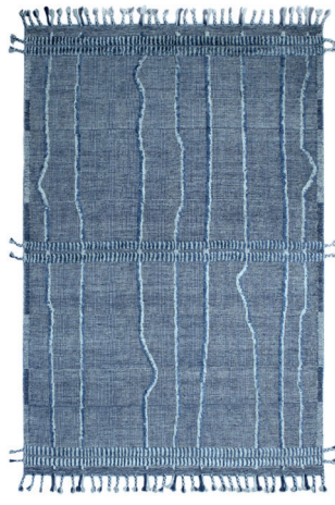
CLN 6199 Blu/Grigio