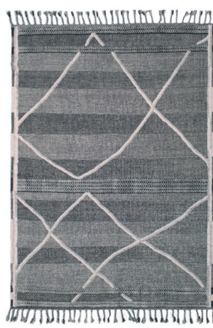
CLN 5014 Nero/Bianco

I dati forniti in questa scheda tecnica sono aggiornati al momento della pubblicazione. Carpet Edition si riserva il diritto di modificare materiali, dimensioni e caratteristiche senza preavviso. The data provided in these technical specifications are up to date at the time of publication. Carpet Edition reserves the right to modify materials, sizes and characteristics without notice.